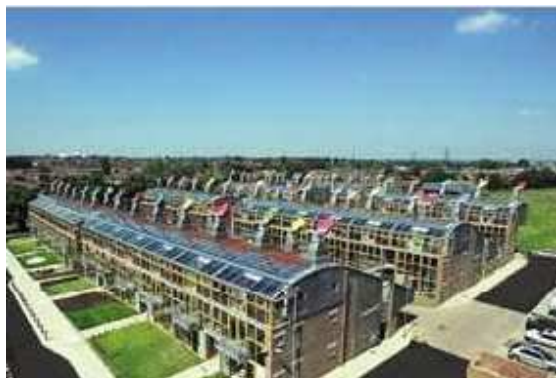
BedZed Ecovillage, London

نمونه های شهری و روستایی دهکده های سالم هر دو وجود دارند. گاه یک دهکده کاملاً جدید با گردهمایی گروهی از اندیشمندان، تحصیلکردگان یا فعالان زیست محیطی پی ریزی می شود و گاه اهالی یک روستای موجود، با کسب دانش و مهارت های اجتماعی و فناوری های مناسب، جامعه محلی خود را به دهکده ای سالم بدل می سازند. به لحاظ نیاز مبرم