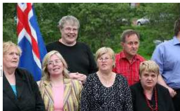
مرکز توانبخشی معلولین ذهنی در دهکده سالم سولهایمر در ایسلند