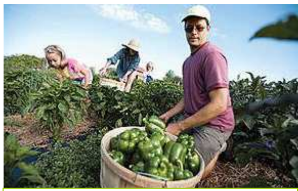
Dancing Rabbit Ecovillage, U.S.A. مزرعه تعاونی کشت و مصرف در دهکده سالم دنسینگ رایت، آمریکا

www.eabbassi.ir/localdevelopmentplnplcy_orgagmark_csa.htm