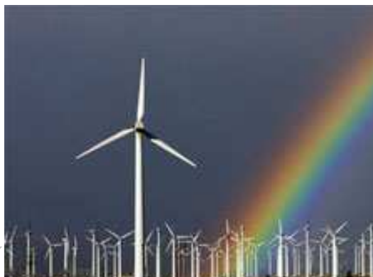
تعاونی تولید انرژی بادی در دهکده سالم فیندهورن، اسکاتلند

تاریخا بهره برداری از منابع طبیعی در روستاها برای کسب درآمد در قالب تولیدات زراعی، باغی و دامی متبلور شده است. در دو سه دهه اخیر ترویج گردشگری در روستاها نیز به عنوان منبع درآمد بالا گرفته است، اما این فعالیت اقتصادی نتایج ویرانگری داشته است چرا که هجوم خیل گردشگران معمولا محیط کوچک روستا را لگدمال می کند و زباله ای که از گردشگران برجای می ماند دردسر ساز است. راه های مفیدتر و عزتمندانه تری برای کسب درآمد و بهره گیری از محیط روستا وجود دارد. دانش و فناوری های جدید افق های جدیدی برای نوآوری در تولید و اشتغالزایی در روستاها گشوده است. تولید انرژی بادی و خورشیدی و ارائه خدمات اجتماعی از این جمله فعالیت های نوآورانه در دهکده های سالم بوده است.