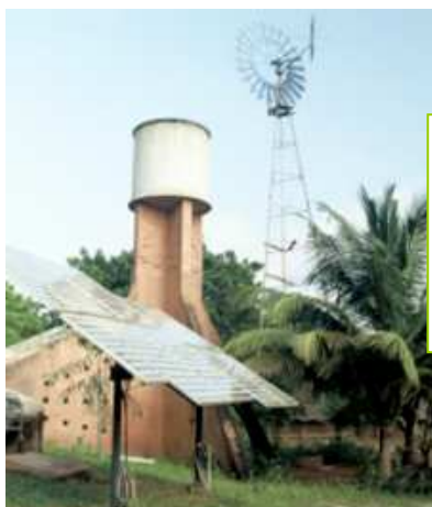
تولید انرژی خورشیدی برای مصرف محلی (چپ) و کارگاه تولیدی پانل های خورشیدی (راست) در دهکده سالم اورویل در کشور هند Auroville Ecovillage, India

توانایی های علمی بشر در بازسازی زیست کره از آن برای تولید و کسب درآمد نیز یاری جست. در دهکده های سالم اهالی معتقدند که سعی در بهره کشی از منابع آب، خاک، هوا و انواع کانی ها به منظور رقابت در کسب ثروت فردی عاقلانه نیست چرا که آنان به خوبی می دانند که این نوع از رقابت به نابودی منابع می انجامد و این نابودی به سود هیچ کس نیست.