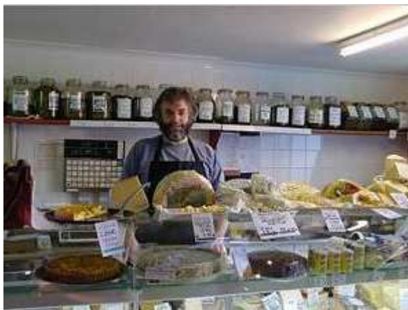
فروشگاه نانوایی با سرمایه گذاری های خرد محلی در دهکده سالم فیندهورن، اسکاتلند Findhorn Ecovillage, Scotland

از آنجائیکه همبستگی در دهکده های سالم بین اهالی قوی است، انرژی و تکاپو در حوزه اقتصادی خود را نه به صورت رقابت در استخراج منابع طبیعی و ثروت اندوزی فردی بلکه در بالا بردن کیفیت زندگی برای عموم مردم و حفاظت از منابع طبیعی نشان می دهد. زیرکی و هوشمندی اقتصادی در دهکده سالم به این است که چگونه از طریق دانش و با الهام گرفتن از خود طبیعت نیروهای آن را مهار کرد و بدون کاستن از